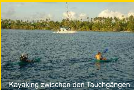
Kayaking zwischen den Tauchgängen