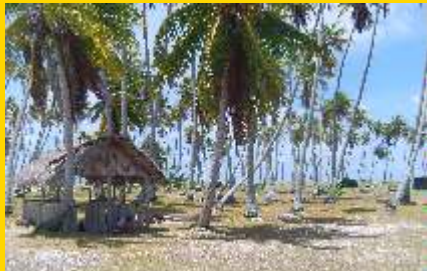
Das kleine Dorf Garumaoa