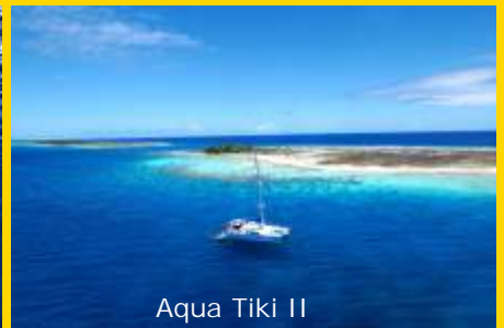
Aqua Tiki II

Ankern werden wir in der Lagune vor einem kleinen Motu. Hier in Raroia haben wir den eigentlichen Höhepunkt unserer Reise erreicht und tauchen an dem wohl besten Tauchplatz von Französisch Polynesien. Es gibt hier neben den vielen grauen Riffhaien, Mantas und riesigen Fischschwärmen auch den großen Hammerhai und Silberspitzenhaie. Mit etwas Glück sehen wir auch Tigerhaie und Schwertfische.