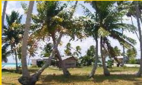
Das kleine Dorf Garumaoa