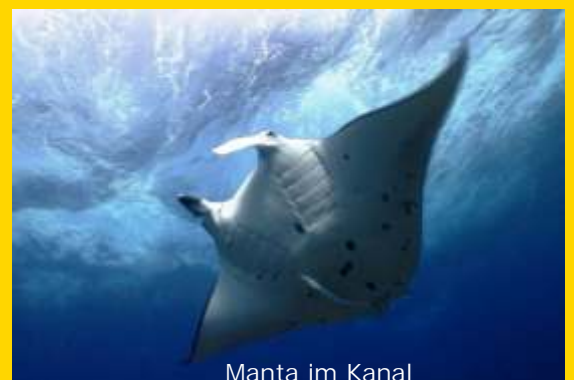
Manta im Kanal