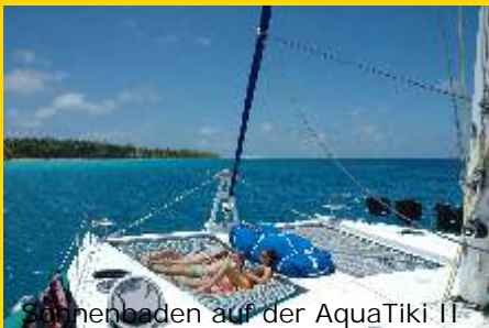
Sonnenbaden auf der AquaTiki II

Überfahrt nachts ca. 6 Std. nach Tahanea