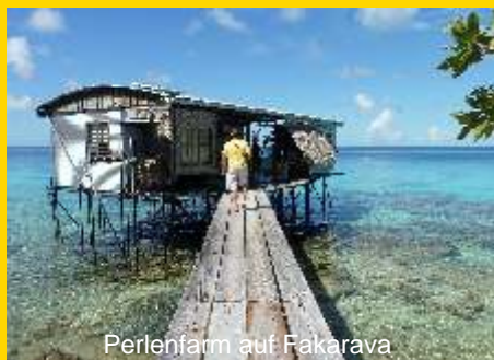
Perlenfarm auf Fakarava

Am Morgen haben wir die Möglichkeit eine kleine Perlenfarm zu besuchen. Hier wird uns der Weg der Perle vom Rohling bis zur fertigen Perle gezeigt. Im Anschluss hat jeder die Gelegenheit für kleines Geld (ab 10 €) eine der berühmten Tahiti-Perlen als Andenken an unsere wundervolle Reise zu kaufen.