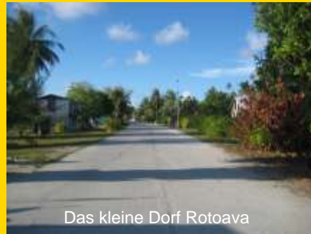
Das kleine Dorf Rotoava

Nachmittags Transfer zum Flughafen und Flug mit der Air Tahiti nach Papeete