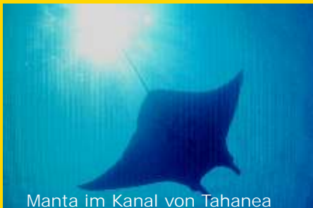
Manta im Kanal von Tahanea

Überfahrt nachts ca. 7 Std. in den Süden von Fakarava.