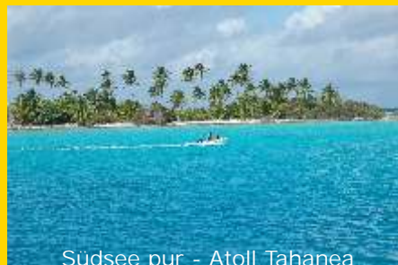
Südsee pur - Atoll Tahanea