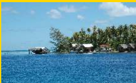
Te Ta Manu im Süden von Fakarava

das zweitgrößte Atoll Französisch Polynesiens, ist ein 60 km langes und 25 km breites Rechteck mit zwei Hauptdörfern: Rotoava im Nordosten an der 1 km breiten nördlichen Riffpassage Ngarue, und Tetamanu, das an der südlichen schmalen Riffpassage Tumakohua gelegene Dorf.