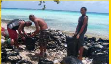
Perlenzüchter bei der Arbeit

Das Außenriff ist mit wunderschönen mit Hartkorallen überzogen. Hier trifft man neben den großen Fischschwärmen auch Mantas an, die mit etwas Glück im Blauwasser für uns tanzen. http://youtu.be/1AKsOUDR9yg