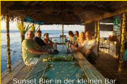
Sunset Bier in der kleinen Bar