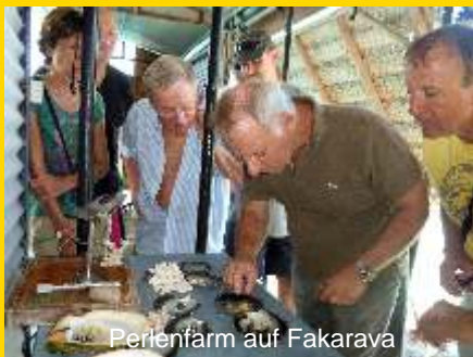
Perlenfarm auf Fakarava