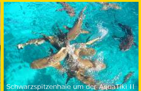
Schwarzspitzenhaie um der AquaTiki II