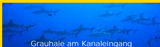
Grauhaie am Kanaleingang