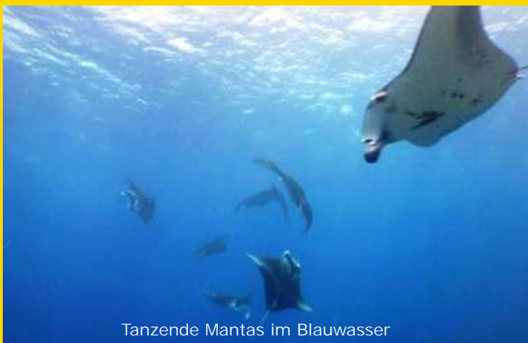
Tanzende Mantas im Blauwasser

Überfahrt nachts, nach dem letzten Tauchgang in ca. 11 Std. nach Makemo.